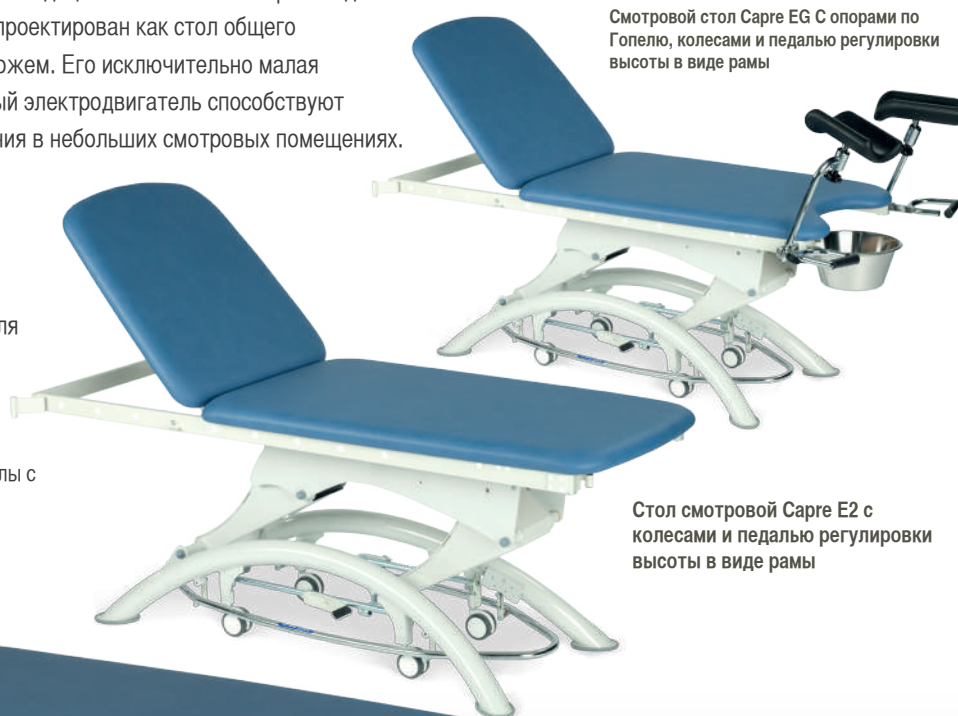
Смотровой стол Capre EG с опорами по Гопелю, колесами и педалью регулировки высоты в виде рамы

“Исключительно широкий диапазон высоты, пожалуй, лучшие смотровые столы в своем сегменте на рынке”.