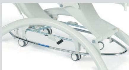
Педаль 360° в виде рамы по периметру стола, для регулировки высоты