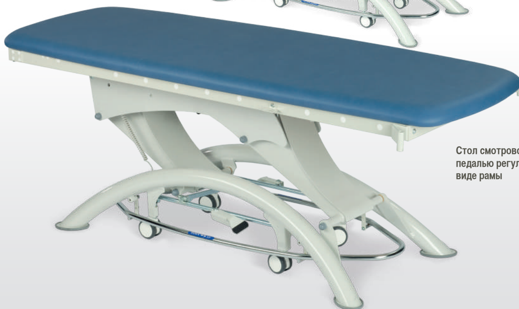
Стол смотровой Capre E1 с педалью регулировки высоты в виде рамы